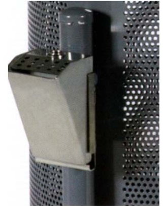
Opcional: Cenicero para papelera