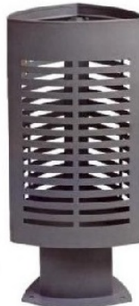
Scuderia: Cod. C-2009METAL