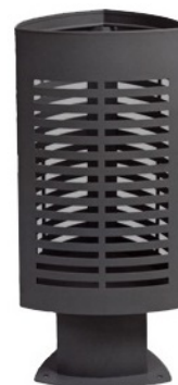
Scuderia: Cod. C-2009NEGRO