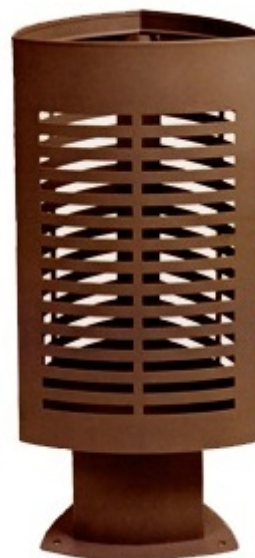
Scuderia: Cod. C-2009MAS.